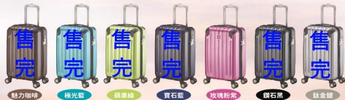
魅力咖啡 極光藍 蘋果綠 寶石藍 玫瑰粉紫 鑽石黑 鈦金銀